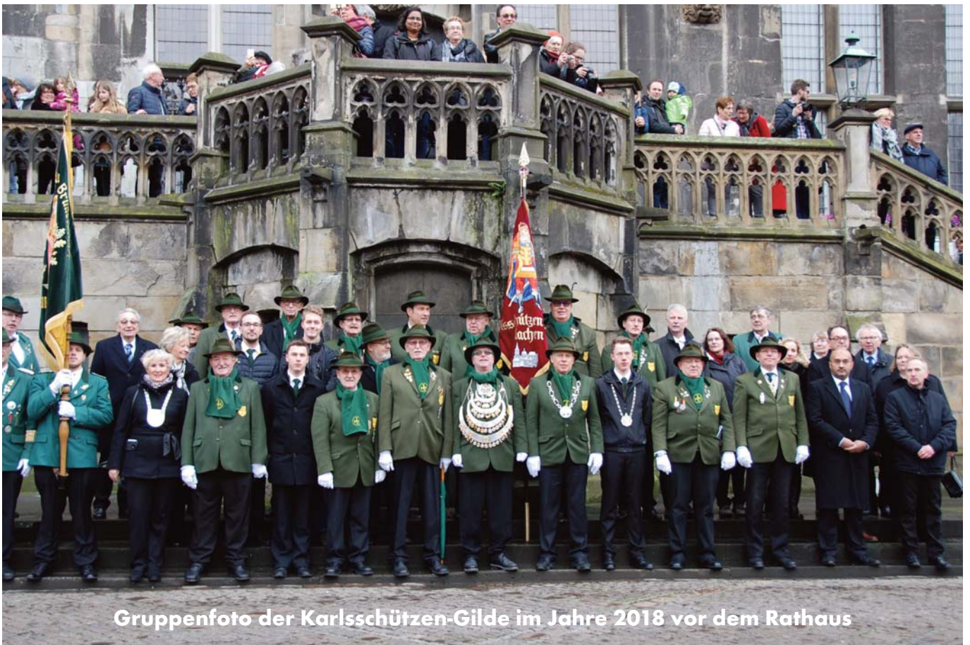
Gruppenfoto der Karlsruhützen-Gilde im Jahre 2018 vor dem Rathaus